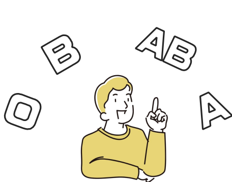
血液型で相手の性格を決める