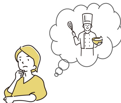
男性がお菓子作りを好きなのはおかしい

アンコンシャス・バイアスは、誰にでもあるものであり、あることそのものが悪いわけではありません。問題なのは、気づかないうちに「決めつけ」たり「押しつけ」たりしてしまうことです。