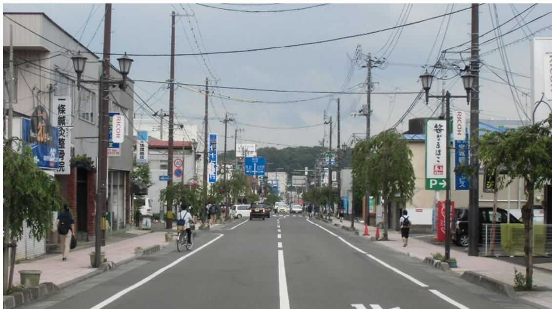
区を縦断する県道船岡停車場線