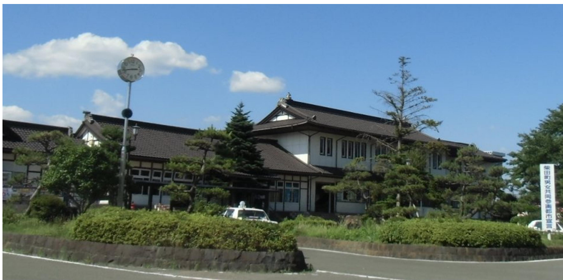
柴田町の玄関口 JR船岡駅