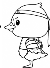
みやぎハローワークキャラクター 「カンちょーさん」