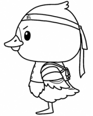
みやぎハローワークキャラクター 「カンちょーさん」