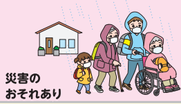
災害の おそれあり