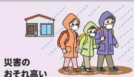
災害の おそれ高い