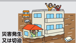
災害発生 又は切迫