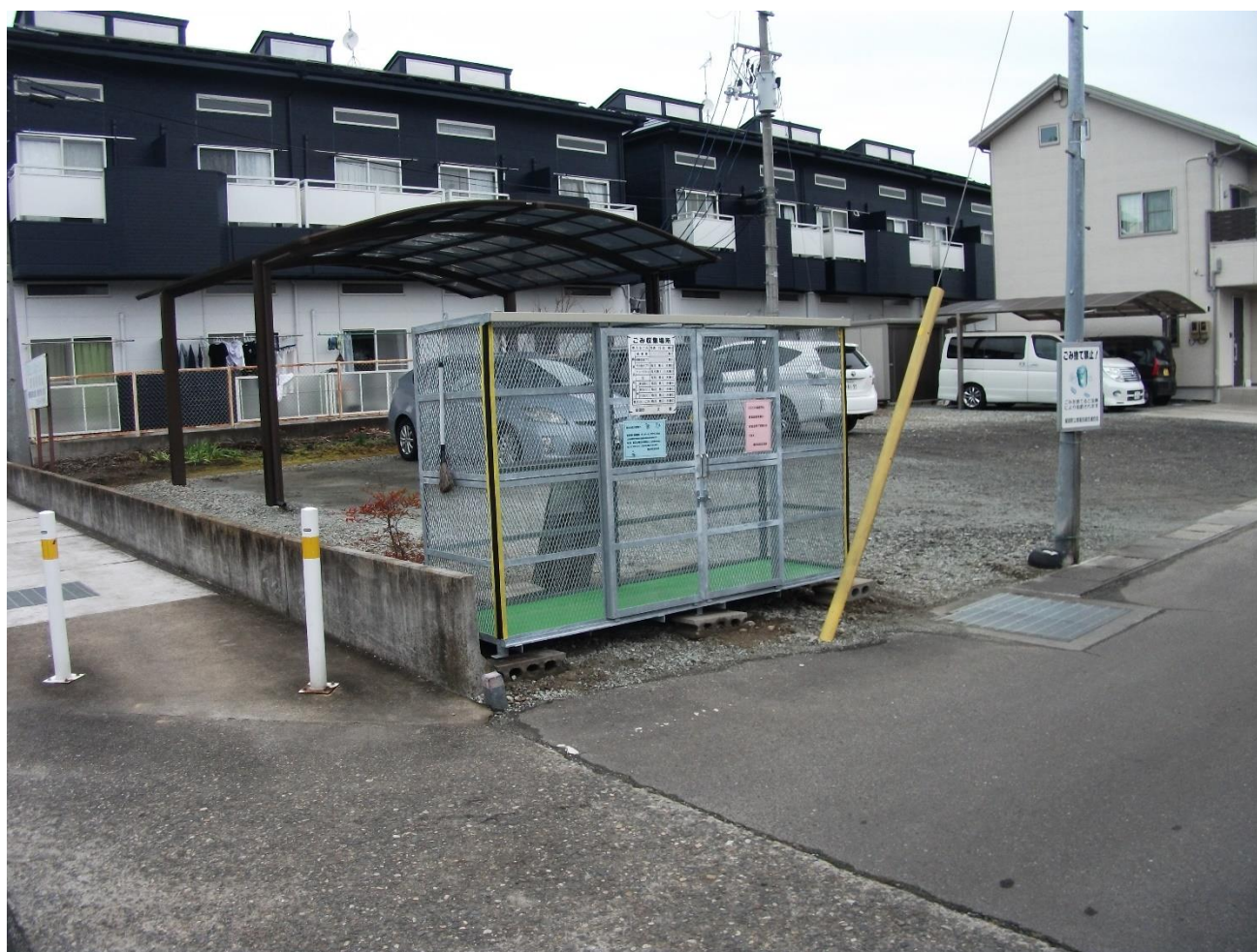
ごみ集積所の改修事業