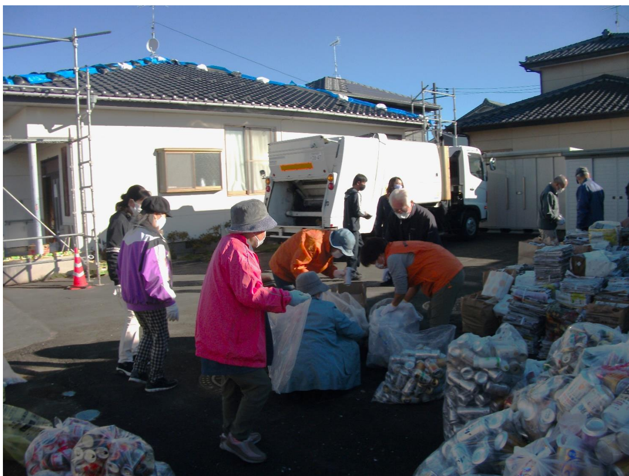
毎月第2土曜日に行われている資源回収事業