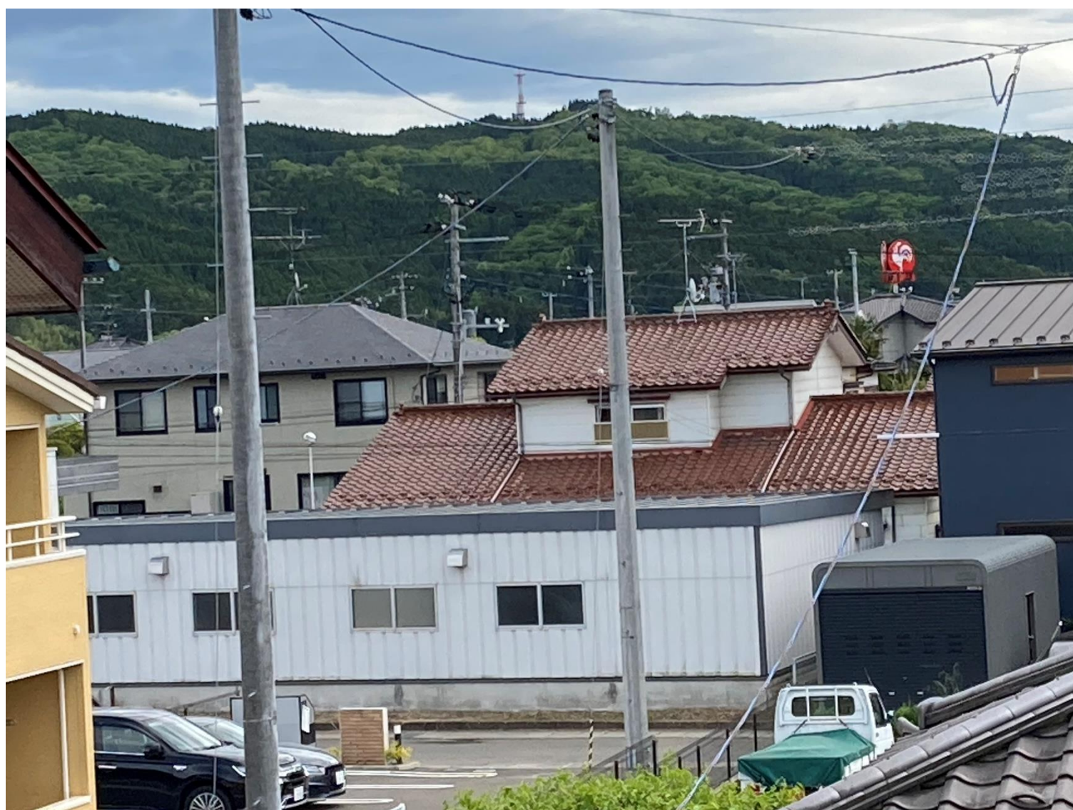
14区を見守る七畝山