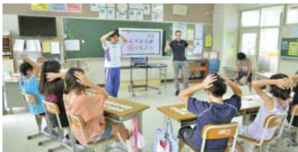
電子黒板を使用したALTの授業風景。

※ICT（情報通信技術）を活用して「わかる授業」を実現するため、平成21年度に各小中学校に1台設置しました。