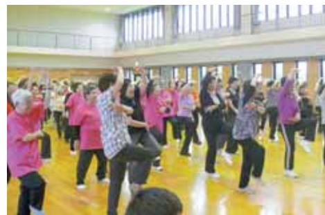
ロコモ予防研修会で楽しく実技する参加者の皆さん。

地域包括支援センターは、「玄米ダンベル」や「ノルディックウォーキング」などのサークルの活動支援を行っています。また、地域で行われる出前講座への職員派遣を通して、高齢者が楽しく無理なく続けられる運動の相談や支援もしています。