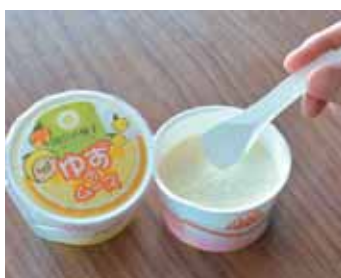
やわらかい食感と風味が美味しい「ゆずムース」