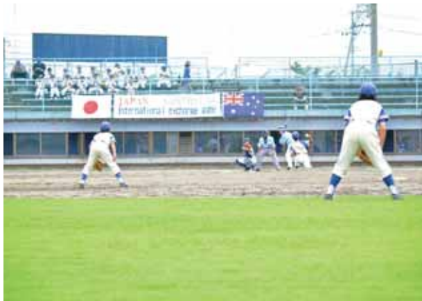
白熱のプレーを見せる両チーム。