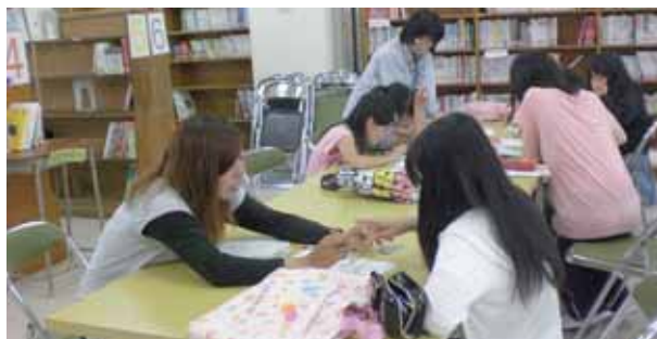
学び支援員による学習支援。

また、高校受験を控えた中学3年生を対象として、冬季休業期間中に、自主的な学習の場を設けた「冬季受験力アップ学習会」を開催しています。この学習会