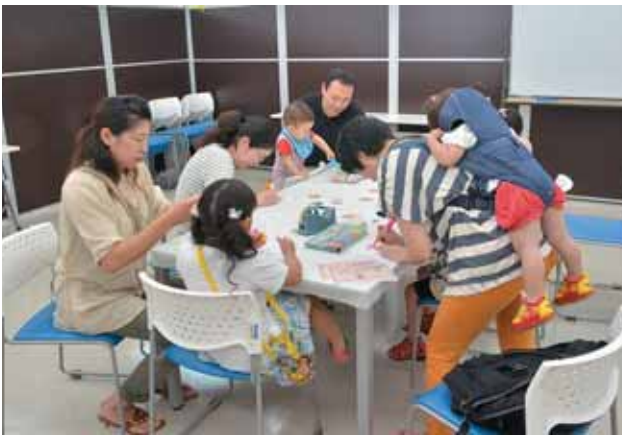
かわいいキーホルダーが出来るかな？