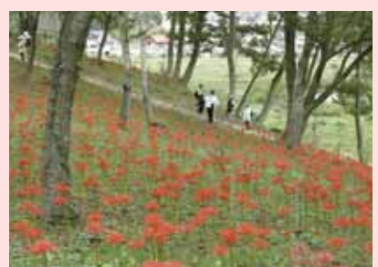
〔縦ノ木は残った展望デッキ〕へ向かう園路脇の斜面 平成24年10月上旬撮影