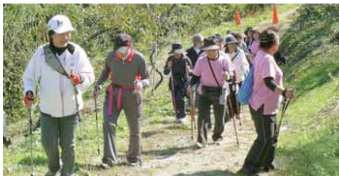
ノルディックウォーキングで楽しく運動する皆さん。

健康状態や体力、運動経験などにより個人差はありますが、高齢になると筋力量や筋力が減少します。しかし、「年だから」と諦めてしまうと、ますます減少してしまいます。最近の研究では、高齢でも習慣的に運動を行うことで、運動器の機能は向上するとされています。