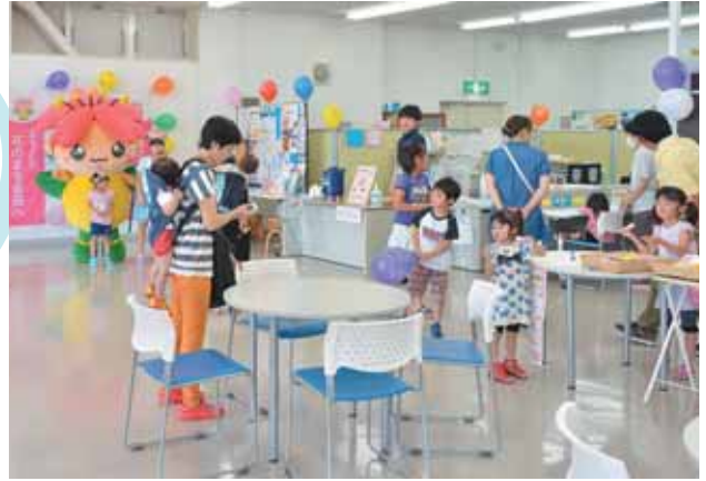
お友達といっぱい写真を撮りました。