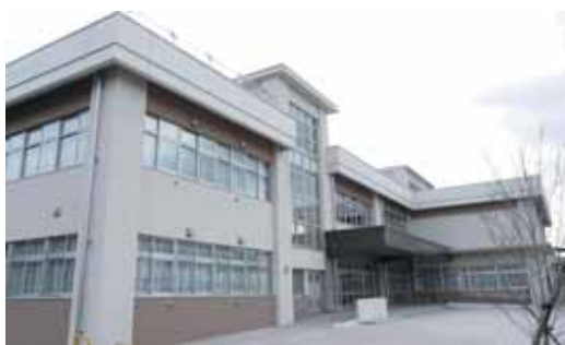
完成した榎木中学校。

○安心・安全な教育環境の整備 学校施設が果たすべき役割は、第一に児童生徒の安全確保です。児童生徒の安全確保のため「スクールガードリーダー」と「地域見守り隊」などによる通路や校内の見守りを、引き続き実施していきます。 また、学校施設は地域住民の避難所としての役割を担っており、町では、災害に強い学校施設づくりのため、校舎・体育館などの耐震補強工事、老朽化した施設の改修、学校設備の整備