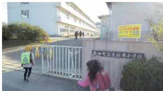
県内唯一のコミュニティ・スクールである東船岡小学校。

反映と参画を図って、学校の外部評価を実施するなど、地域とともに創る学校づくり・信頼される学校づくりを目指して教育活動や学校運営の改善に努めています。