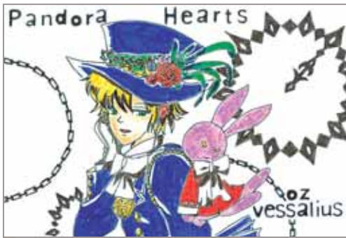
女王の番犬 (ペンネーム)