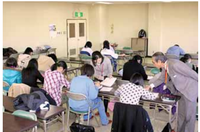
集中的に勉強することで学習力アップ

志望校合格を目指して頑張る中学3年生を対象にした町教育委員会主催「冬季受験力アップ学習会」が1月5日から3日間、船迫生涯学習センターで行われ、延べ35人の生徒が参加しました。この学習会は、自主的な学習の場を提供し、受験へ向けた意識啓発を行うことを目的に行われたもので、今回で2回目。学習支援ボランティアの皆さんが、一人一人のレベルに合わせて数学と英語を丁寧に指導していただきました。