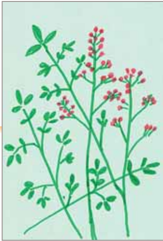
花ちゃん (ペンネーム)