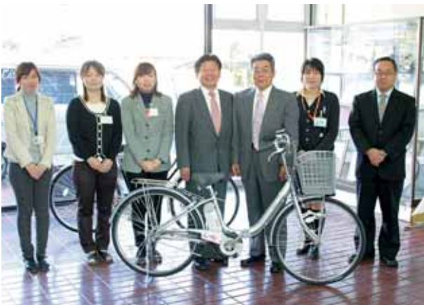
寄贈された自転車は、保健師の足として活用されます