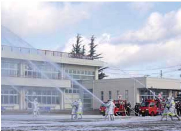
防火への決意を新たに一斉放水