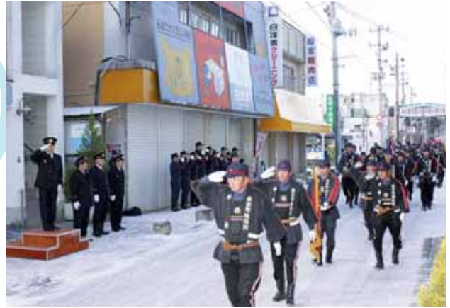
消防団長を先頭に分列行進