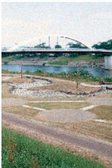
水の流れないせせらぎ親水池

しかし、県では白石川のもつ自然環境を、子供たちの生きた教材とし、遊びの空間、あるいは、ふるさとの自然観察の場