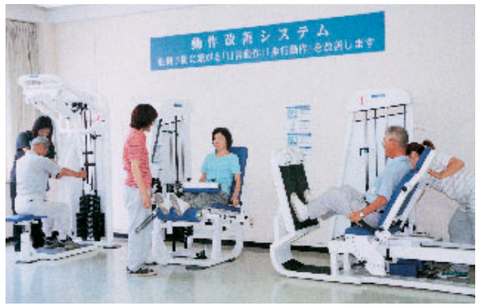
仙台大学での「ころばぬ先の元気塾」