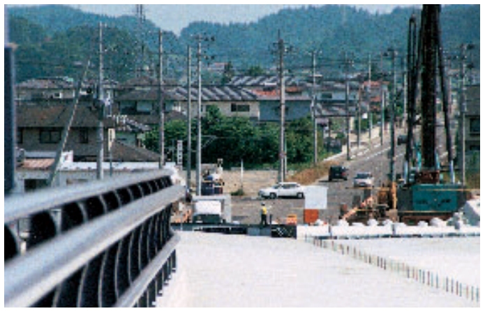
開通が待たれるさくら船岡大橋