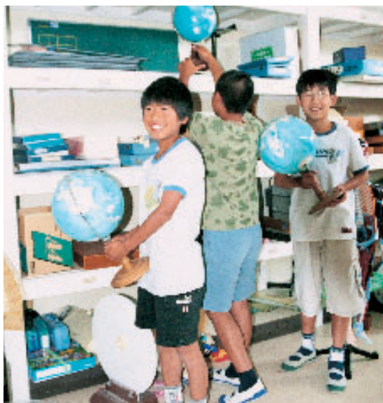
小学校の教材保管室

では、校長会の際に指導していきたい。(5) 公費については十分把握しているが、私費についてはわからない。