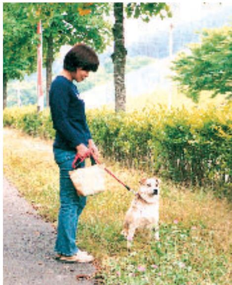
ルールを守り犬の散歩

こうした運動を進めつつ、やはり一方では取締りについても強化していかねばならない時期なのかもしれないと思っております。