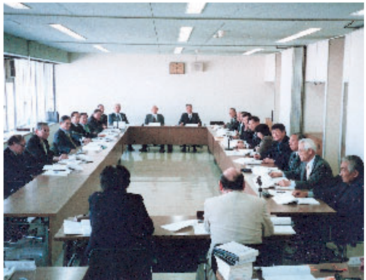
予算審査特別委員会

町議会の重要な役割の一つに議案審議があります。町長提出議案は、予算・各種条例関係です。議員提出議案は、条例関係、意見書や決議など議会の意思表示となります。平成15年の議案審議を数字でレポートしていきます。