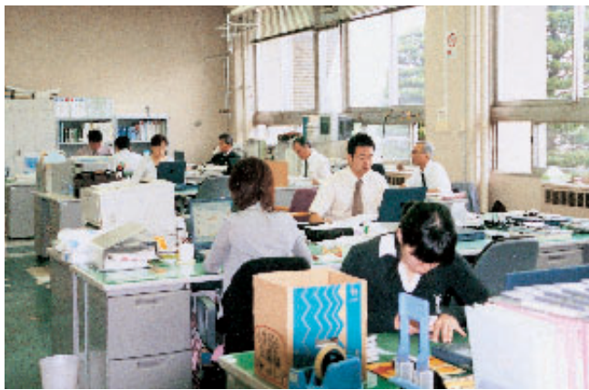
忙しさを増す合併協議会事務局