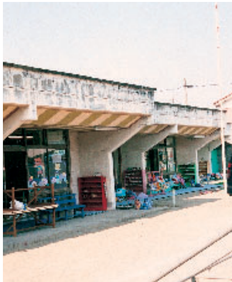
老朽化が激しい船岡保育所