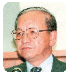
星 吉郎 議員