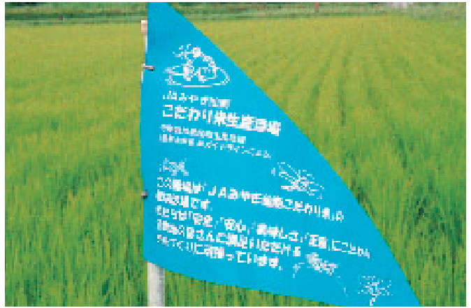
こだわり米の米づくり

問 わが国の農業も、ウ ルグアイ・ラウンドの世 界貿易の影響を受け、大 きく変換せざるを得ない。