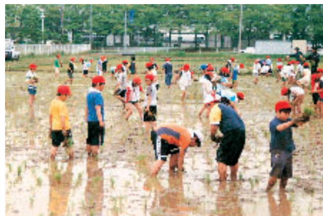
創造性をはぐくむ学習田