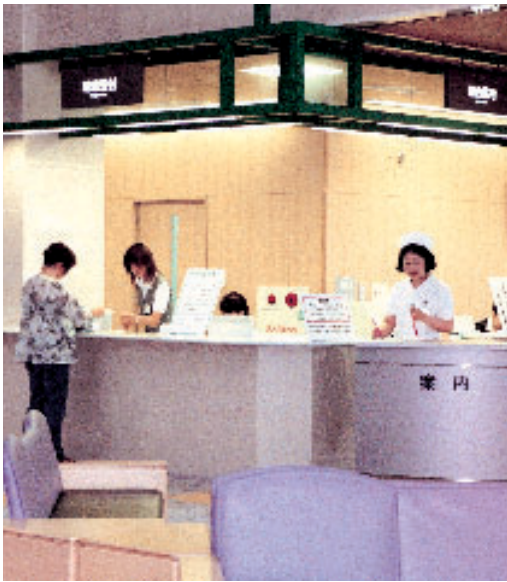
地域住民に期待されている中核病院

Q この10割の値上げで何年対応できるのか。 A 国保会計の原則で、1年1年のスパンでの確かな収支バランスを取れるような見通しを立てていきます。 Q 資産割のアップ率が高いのは、かけやすいところにかけているようで、あまり良い方法でないと思うが。 A 資産割については国民健康保険税のシステム上決まっていることで、柴田町独自というのではありません。