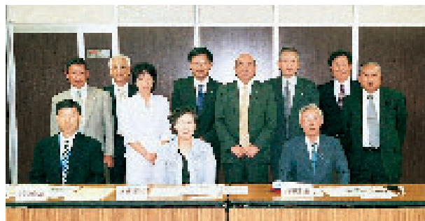
村上市編集委員を囲んで