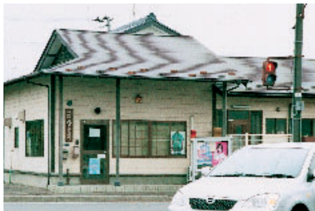
移転要望の高い槻木駐在所

問 槻木駅周辺は、人口も世帯数も増加し、都市化への変化が著しく、その治安維持が急務となっております。特に槻木駅西地内はアパート建築が著しく、今後とも人口が増えるものと予想されます。