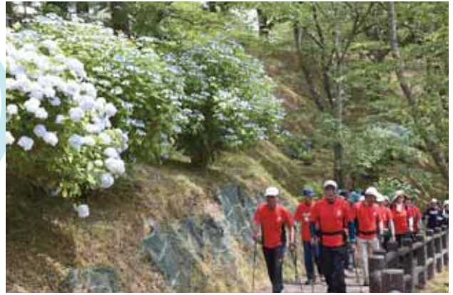
今年のアジサイは、 例年よりも1週間早く見頃を迎えました。