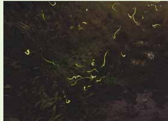
⑦ 20:00頃になるとこんなにホタルが。多いときには、数百匹のホタルの乱舞が鑑賞できます。(6月22日撮影)

「富沢磨崖仏群」は鎌倉時代から現在まで先人から受け継がれ、地域の皆さんが日々大切に管理してきました。