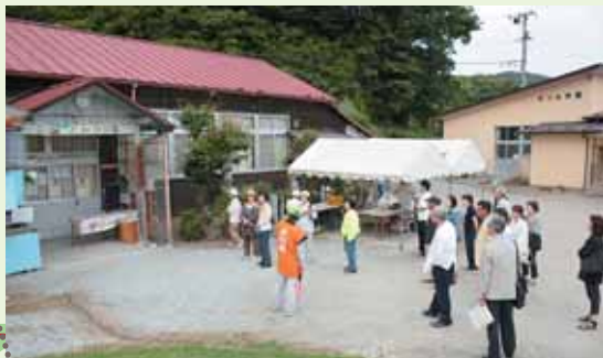
② 18:30 夕食会場へ向かう途中、ちょっと寄り道。 産地直売所ブチみちの駅「とみかみ」