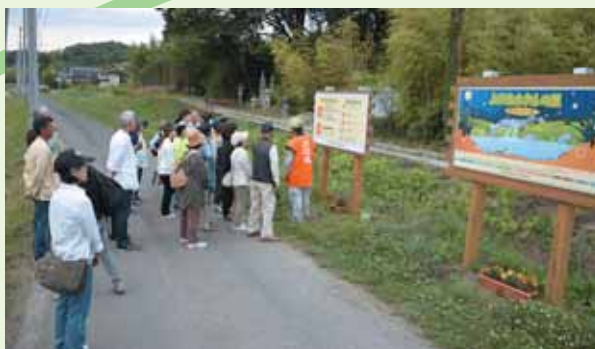
④ 18:55 平間区長から、ホタルの一生について、説明がありました。