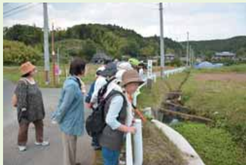
③ 18:40 ゲンジボタルの現れる水路を眺める 参加者の皆さん

柴田町の北東部に位置する富沢・上川名地区。両地区は、水田や里山のある自然豊かな地区です。また、魅力のある地域資源が豊富で、地元の方々が古くからある史跡や自然を守り継いできました。 6月19日(金)、20日(土)には、柴田町観光物産協会の主催で上川名地区に現れるホタルと鎌倉時代に崖に彫られた富沢磨崖仏群の鑑賞ツアーが行なわれました。