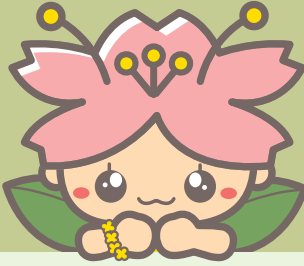
花のまちイメージキャラクター ほほみちゃん