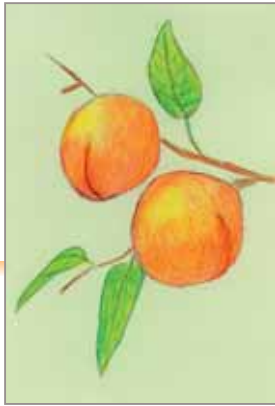
はなちゃん (ペンネーム)