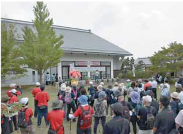
開花式にはたくさんの方が集まりました。