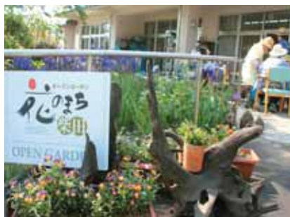
ティサービスセンターまごころホームのお庭 (地域福祉センター内) 木、日曜日を除き公開10:00～15:00