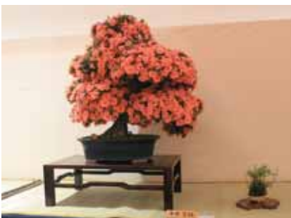
柴田盆遊会 第17回粋な文化展 6月3日～5日開催