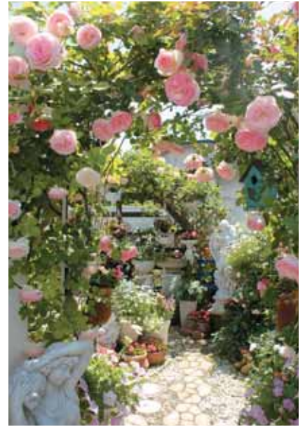
佐野純子さんのお庭 (船岡) 6月5日開催