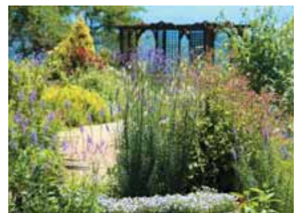
コミュニティガーデン「花の丘 柴田」 常時公開