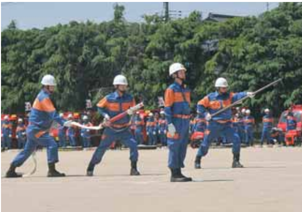
ポンプ車操法訓練を行う団員