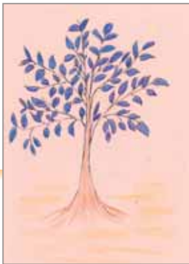
はなちゃん (ペンネーム)

smile kids お子さん(4歳まで)の写真をお待ちしています。写真の裏にお子さんの名前を必ず書いてください。投稿者の住所、氏名、電話番号、お子さんの名前・生年月日を明記し、「ひとこと」を添えて応募してください。