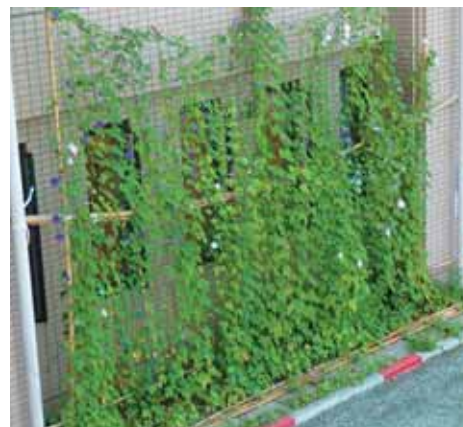
昨年の船岡生涯学習センターのグリーンカーテン

船岡生涯学習センターでは毎年、ホールやセンター入り口の周りに植物を育てています。利用者の方からも「涼しくて気持ちいい」と評判です。