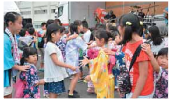
新小路子ども会によるO×ゲームやジャンケン大会も行われました