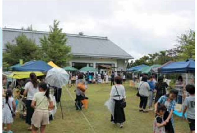
当日はあいにくの悪天候でしたが、約1,000人が来場しました