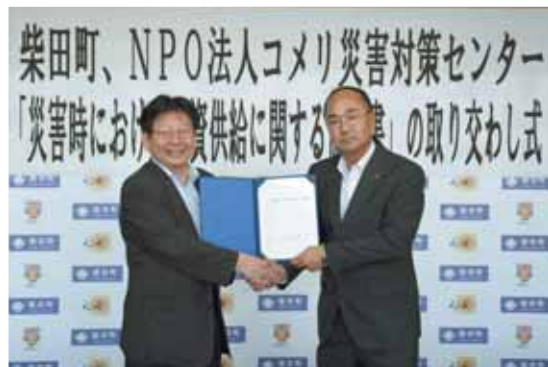
NPO法人コメリ災害対策センターとの協定締結は、県内自治体で22例目となります