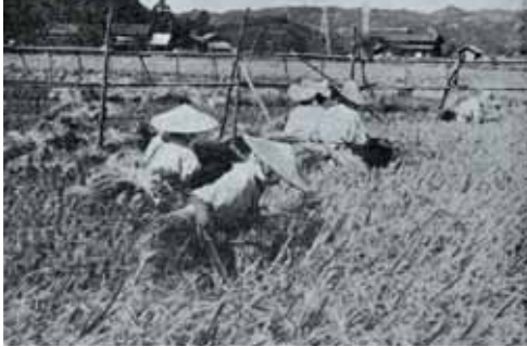
昭和40年、槻木新遠島地区。 まだ機械が広く普及する前の稲刈りの様子です。

実りの秋。稲穂が黄金色に輝き、 収穫の季節を迎えます。 昭和40年頃の稲刈りの風景です。