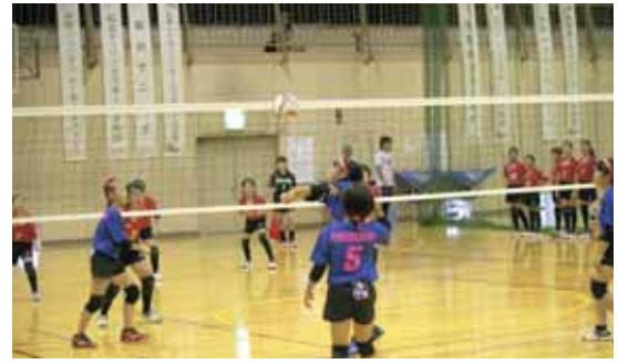
バレーボールでは船迫チエリースポーツ少年団が惜しくも準優勝