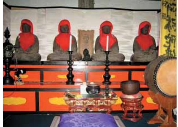
汗かき阿弥陀如来像

「阿弥陀如来像」は「汗かき如来」の愛称で呼ばれており、養蚕の守護神として信仰され、県指定文化財です。