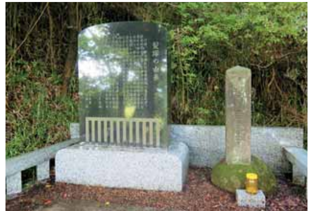
櫻井喜吉髪塚 (本船迫字館山 地内)

明治時代、槻木の医師である櫻井喜吉 (1862-1916) は、病院のなかった船迫に日曜診療所を建て、無料で10年間病に苦しむ人々を治し続けました。