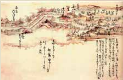
増補行程記（もりおか歴史文化館収蔵）