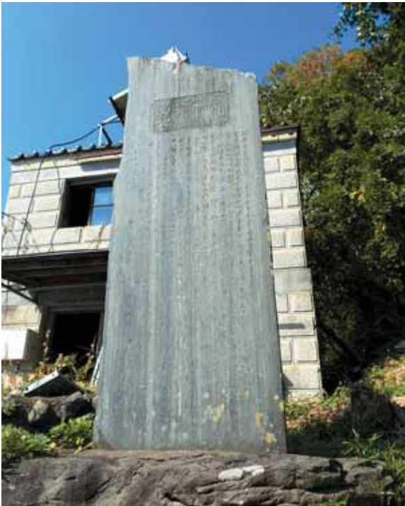
櫻井喜吉頌徳碑 (西船迫一丁目 地内)