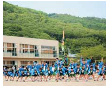
船迫小学校「船迫ソーラン」