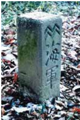
海軍火薬廠境界石 (山崎山公園)