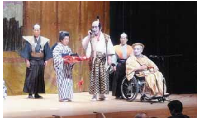
公演「寝たきりになったお殿様」