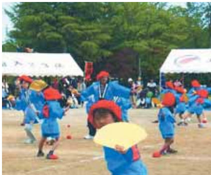
柴田小学校「大黒舞」