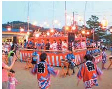
西住小学校「西住子供おはやし」