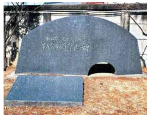
勤労働員学徒の碑(仙台大学正門わき)