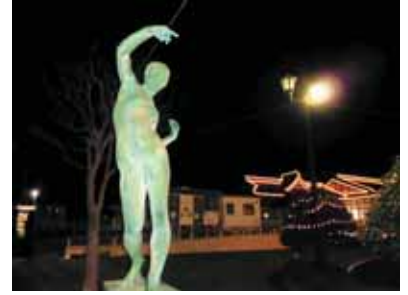
「永遠の女性」 船岡駅前

小室達（1899-1953）は、入間田地区出身で仙台市青葉城址のシンボルになっている「伊達政宗公騎馬像」の作者です。その原型の石膏像はしばたの郷土館に保管されています。