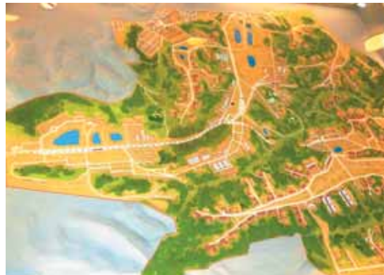
ジオラマ(しばたの郷土館)