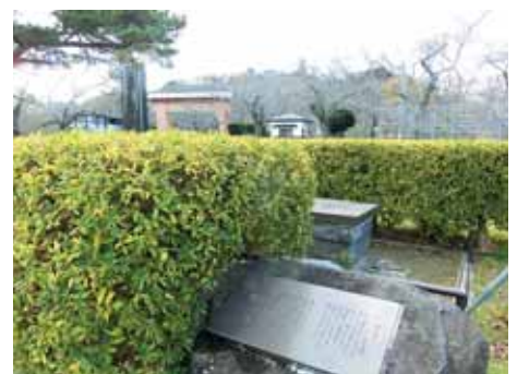
「城中井戸碑」 船岡城址公園