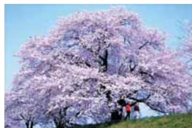
「日本一太いソメイヨシノ」 柴田町さくらの会宣言 (柴田町船岡土手内・白石川堤)

「柴田町さくらの会」は、まちの有志により昭和53年に結成されました。今は、町外の方も会員になるなど幅広い年代の多くの方々によって支えられています。