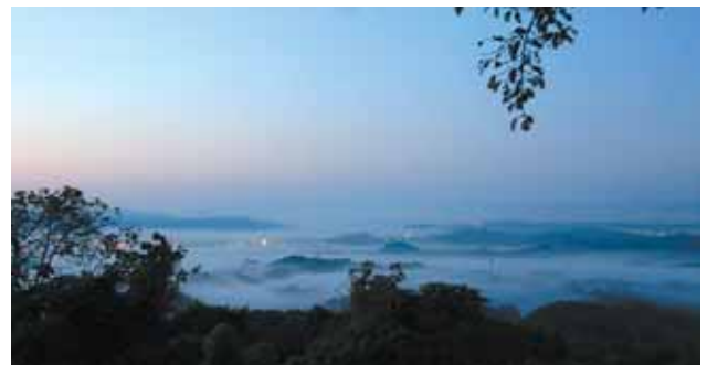
入間田 あまご 雨乞地区からの雲海