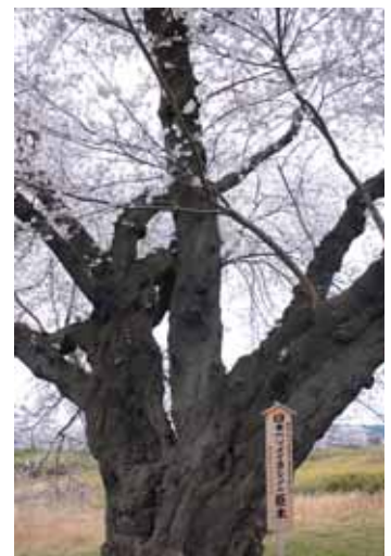
日本一太いソメイヨシノ （柴田町さくらの会宣言）