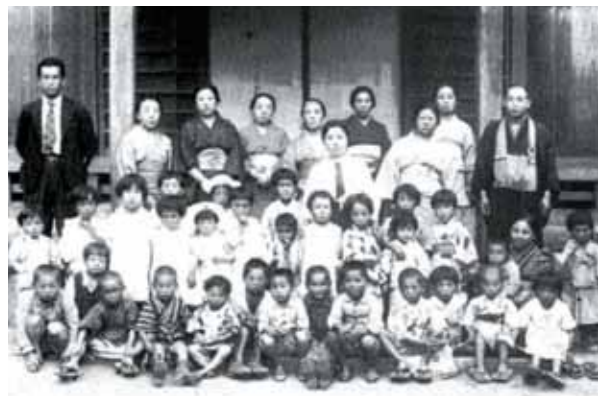
昭和12年頃の浄心隣保館の子どもたち