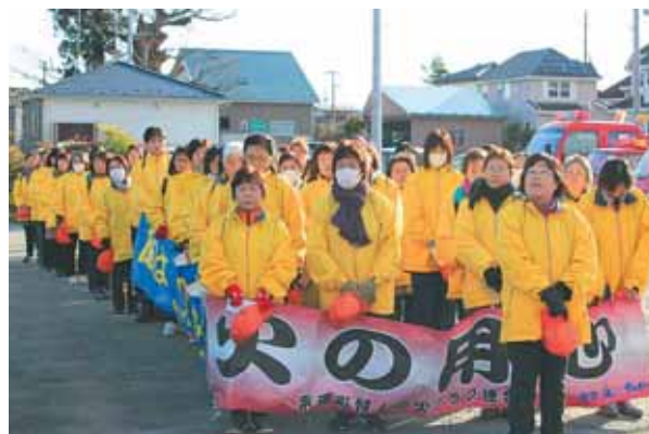
現在の柴田町婦人防火クラブ