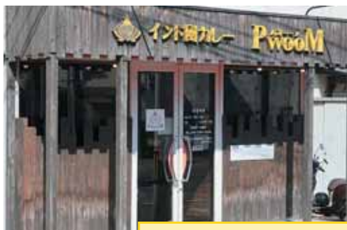
●インド風カレー Pwoom 柴田町西船迫1丁目8-20 TEL：090-2994-5568