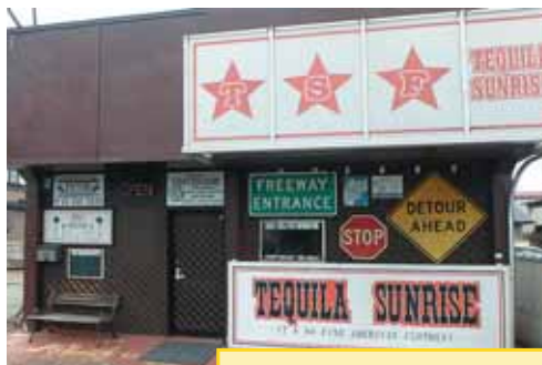
●サンセットブルーバード 柴田町船岡中央3丁目1-16 TEL：0224-57-2828