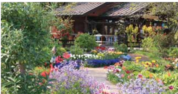
コミュニティガーデン「花の丘 柴田」

「花のまち柴田」の名にふさわしい四季折々の花が町内の至るところにいっぱいです。 手入れの行き届いたオープンガーデンや花の丘、そして様々な街路樹が町内の美しい景観を創り出しています。