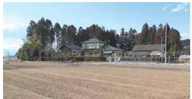
四日市場沖の居久根

風を防ぎ、家を守るために屋敷の周りに木を植えました。大きく育った木は、やがて家を建てるための材料として使われていたそうです。 わずかになりましたが、残したい故郷の風景です。