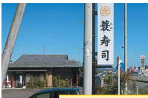
●蓑寿司 柴田町船岡若葉町2-1 TEL：0224-55-3532