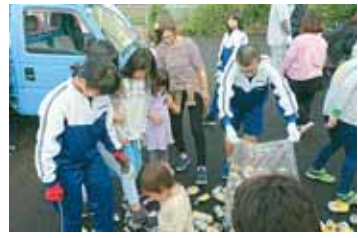
地域の方と一緒に作業を行った廃品回収

廃品回収は多くの地区で実施され、部活動などの練習と折り合いを付けながら参加しました。参加した生徒は、「少人数だったけれども素早く手伝いすることができました」と感想を述べていました。また、地域の方からは、「参加してもらいありがとございました」と感謝の言葉をいただきました。