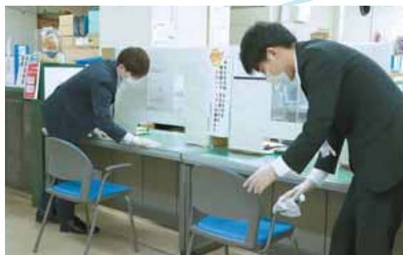
カウンターや椅子の消毒を行っています。