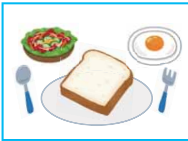
普段の朝・昼ごはん