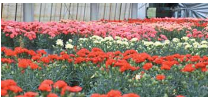
町内で栽培されているカーネーション