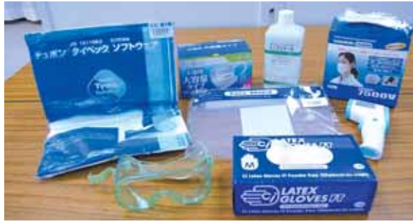
約30日分のマスクなどの医療用資材を確保予定

済的な打撃を受けた店舗等 に対して、事業の継続を支 援するため、支援金10万円 を支給します。