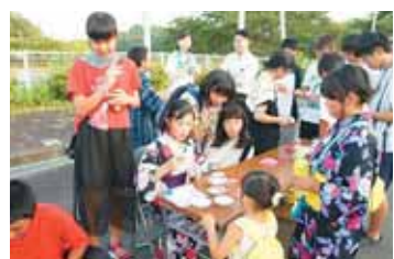
生徒のブースにたくさんの子どもが集まりにぎわいを見せた夏祭り

「スーパーボールすくい」のブースを担当した生徒は、幼い子どもたちが楽しんで参加できるよう優しく声を掛けたり、上手にすくうためのコツを教えたりしていました。また、参加賞を渡したり、盆踊りに参加したりしながら夏祭りを盛り上げていました。