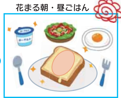
花まる朝・昼ごはん