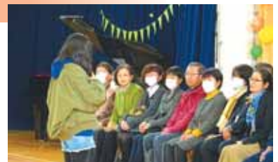
ボランティアの皆さまへ気持ちを伝える「感謝の会」

毎年3月に、これまでボランティアや見守り隊などでお世話になった方々を児童が学校に招待し、ささやかながら、手作りの品々と共に感謝の気持ちを伝える会を開催しています。感謝の会に引き続いて行われる「6年生を送る会」にもそのままご列席いただき、子どもたちのさまざまなパフォーマンスも楽しんでもらっております。