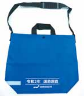
調査員が持ち歩く手提げ袋