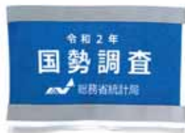
調査員が着用している腕章

被害に遭わないよう、次の点にご注意ください。 ○調査は、電話やメールで行われることはありません。 ○調査には、預貯金や収入などに関する調査事項はありません。 ○調査で金品を要求することはありません。また、銀行口座の暗証番号やクレジットカード番号をお聞きすることもありません。