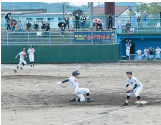
各会場では熱戦が繰り広げられました。