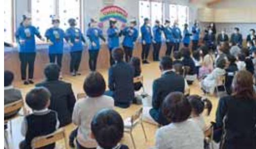
今年4月に開園した町内初の民間の保育園