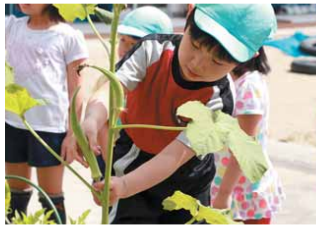
大きなオクラに収穫するのも一苦労でした。

8月17日(月)、西船迫保育所の所庭で栽培している、夏野菜の収穫が行われました。