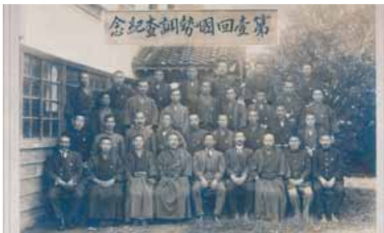
大正9年、槻木町(当時)の第1回国勢調査

国勢調査の結果は、国民共有の統計データを形成し、社会の持続的な発展を支えます。国際社会全体で取り組む「持続可能な開発目標(SDGs)」の基盤情報としても活用されています。