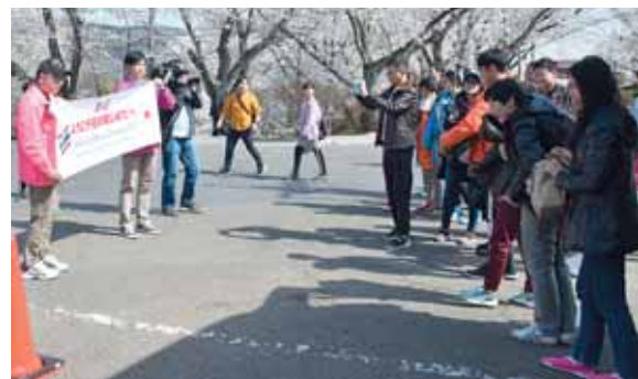
海外でのプロモーション活動により、年々増加する外国人観光客