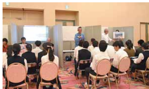
高校生を対象に開催された企業情報ガイダンス