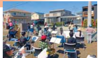
さくらマラソンのコース沿いで応援演奏を披露する吹奏楽部

榎木小には、仙南地区の小学校では唯一となる吹奏楽部があります。過去には、TBC子ども音楽コンクールの東北代表になったり、全日本吹奏楽コンクール東北大会に出場したりと、華々しい実績があります。子どもたちが日々練習に精進していることもありますが、子どもたちの活動を支えていただいている多くの方々がいることも忘れることはできません。地域のイベントなどにご招待をいただいた際や「さくらマラソン」におけるランナーへの応援演奏など、日頃の感謝の気持ちを演奏に託して届けています。