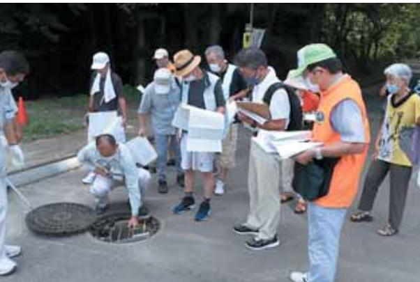
大雨の際には、落下防止柵のあるマンホールを開けて排水します。

所庭では他にも、すいかやメロンを育てており、子どもたちは収穫できる日を心待ちにしています。