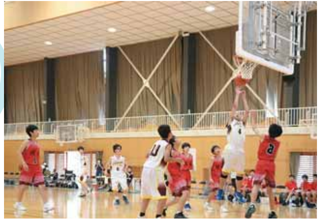
3年生は思い出に残る引退試合となりました。