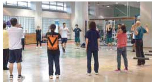
仙台大学との連携による健康タウンしばたプロジェクト