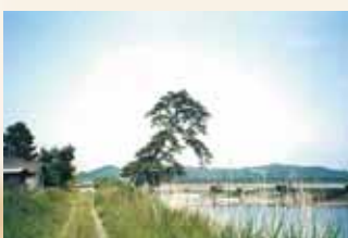
名残の松 (平成3年頃)