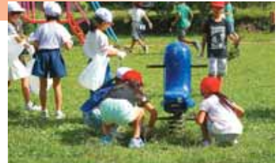
日頃遊んでいる公園でのごみ拾い

自分たちの住んでいる町をきれいにしようと、年に1回、地域のごみ拾い活動を行っています。児童会で原案を立て、代表委員会で話し合います。そうして決定した計画に従い、学年ごとに、学校周辺や近くの公園、榎木駅付近などに出かけてごみを拾います。集めたごみは、児童会の役員が中心となって分別・処分を行います。自分たちが住む榎木へ目を向け、地域への愛情や奉仕の心を養う良い機会になっています。