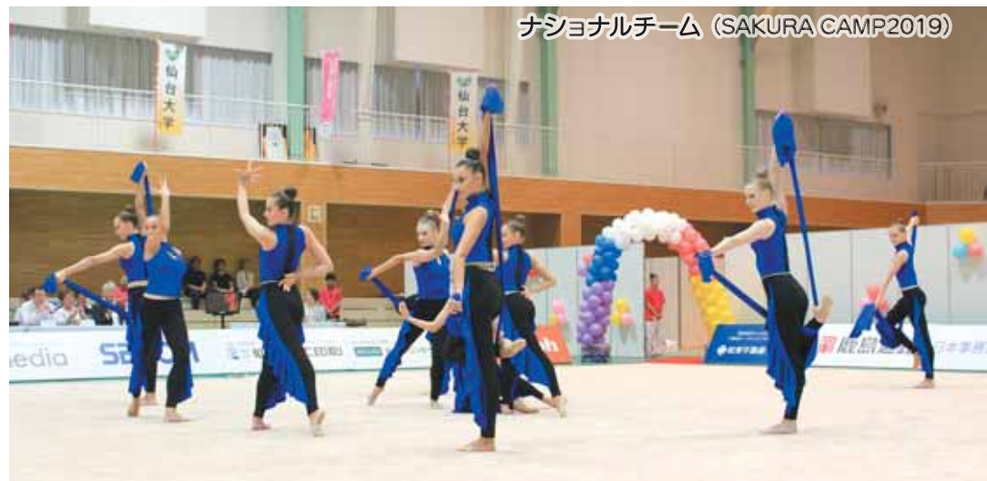
ナショナルチーム (SAKURA CAMP2019)