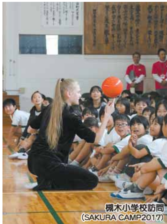
槻木小学校訪問 (SAKURA CAMP2017)