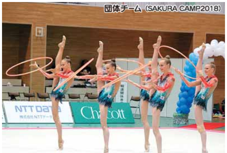
団体チーム (SAKURA CAMP2018)