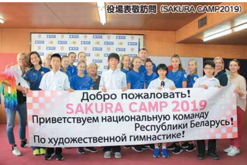
役場表敬訪問 (SAKURA CAMP2019)