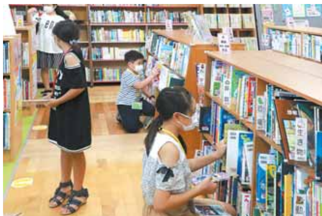
返却された本を本棚へ戻します。