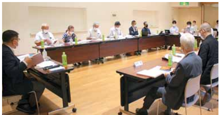
第1回(仮称)柴田町総合体育館建設検討委員会

この検討委員会では、PFIやその他のPPP手法に基づき提案された事業スキームが(仮称)柴田町総合体育館建設事業として有効なのかどうか、評価をしてもらうことが役割ですので、従来の公設公営による建設手法は除外して検討することになります。