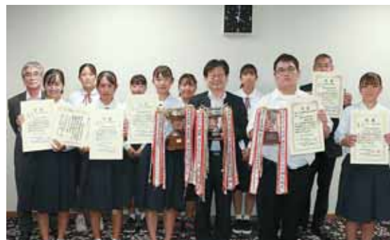
東北大会や全国大会での活躍が期待されます。