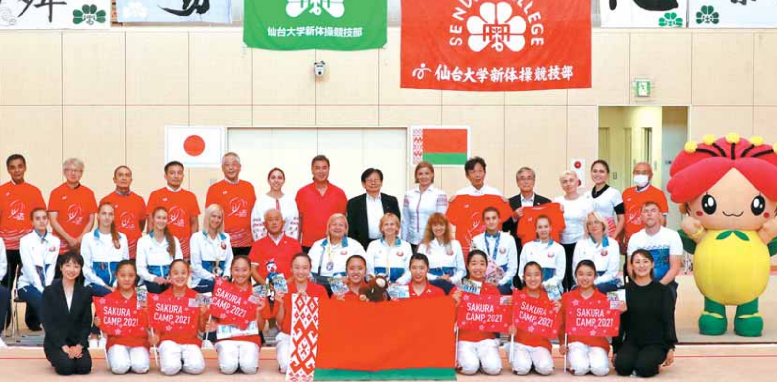
ベラルーシ新体操ナショナルチーム凱旋報告会 (SAKURA CAMP2021)