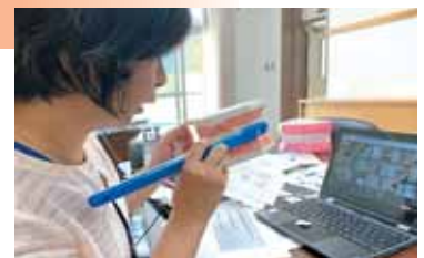
学校と家庭をつないでの歯みがき教室

リモートの利点を実感できる取り組みに挑戦しました。船岡中学校の生徒会と本校の児童会をつないだリモート交流、校長室と各教室をつないだリモート読み聞かせ、教師と全校児童をつないだペーパーレス生活習慣調査の配信・回答など、時間がかかるからと諦めていたことが実現できました。今後も教育的効果のあるリモートの活用を模索していきます。