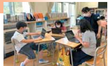
分担して発表資料を作成しています

お互いの考えをパソコンで共有し、多種多様な考えに触れる学習や、友達と分担して作った資料をまとめ、プレゼンテーションする学習などを行っています。パソコンの活用とともに、子どもたちの教科学習に対する探究心が高まり、互いに学び合う姿が見られています。