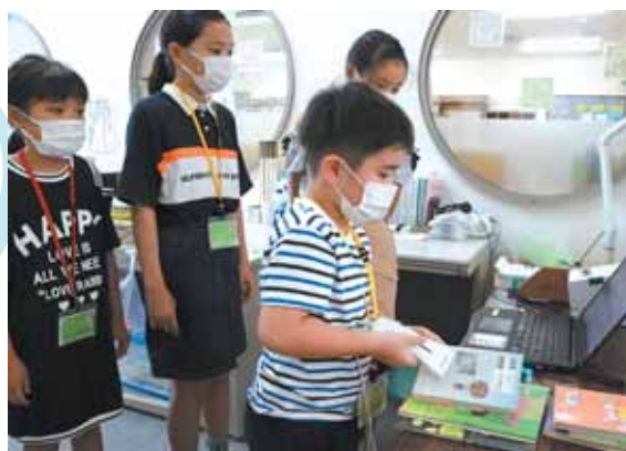
バーコードを読み取って返却の処理をする子どもたち。