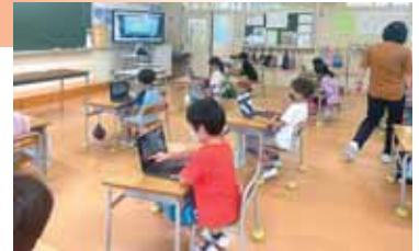
パソコンで算数の問題を解く子どもたち

一人一台端末を生かし、教科書の問題が解き終わった児童からパソコンを使って計算問題に取り組んだり、育ててきた植物をパソコンで撮影して観察カードを作成するなど、「楽しく学ぶ」、「確かに学ぶ」ことを実現する教具として活用しています。