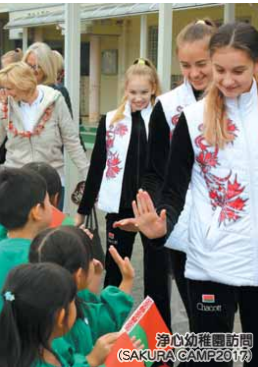
浄心幼稚園訪問 (SAKURA CAMP2017)