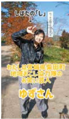
全力で柴田町の魅力をPRしています

主な活動はイベントへの参加やSNSでの情報発信です。昨年に参加したイベントは大小併せて30以上になります。司会やお笑いライブでイベントを盛り上げたり、SNSで告知して集客したりしま