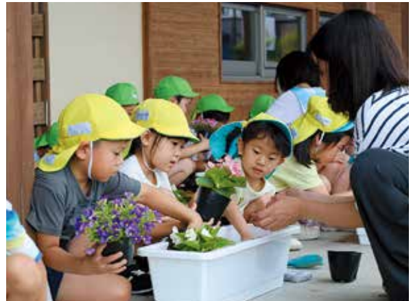
船岡保育所の活動のようす

6月、「人権の花運動」が、船岡保育所、槻木保育所、西船迫保育所の、4・5歳児を対象に行われました。 この運動は、法務省の人権啓発活動地方委託事業として市町村が交替で実施しているもので、花をみんなで育てることで、子どもたちに命の大切さや相手を思いやる心が育っていくことを目的としています。 子どもたちは、色とりどりの花苗を丁寧にプランターへ移植しました。