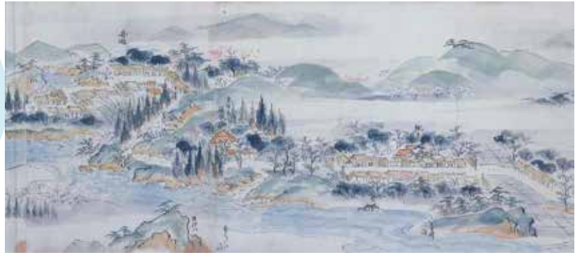
絵図「船迫宿と槻木宿」