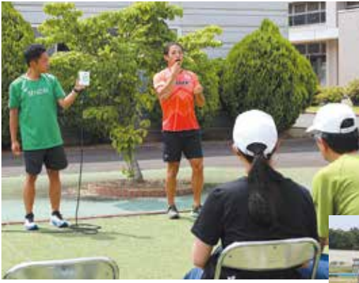
▲スタートランプについて説明

今年「東京2025デフリンピック」が11月に日本で開催されます。仙台大学からは、職員1名ほか4名の学生の出場が内定しており、メダルが期待されます。