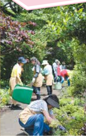
定期的集まり「花の丘柴田」の除草作業や花木の手入れなどを行っています。