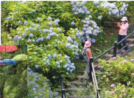
▲青紫色の花に涼を感じます

アジサイ谷では、カラフルなアンブレラが吊り下げられ、ゆらゆらと涼しげな影がデッキに揺らめいていました。梅雨の晴れ間には、きらきらと輝き、まつりの風物詩として訪れた方を魅了していました。