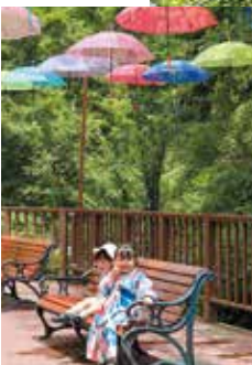
◀アジサイ谷でちょっと一休み