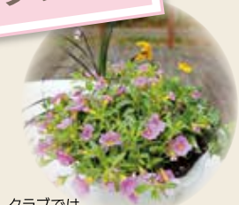
クラブでは寄せ植えのほかスワッグづくりなどアフターガーデニング講習も実施