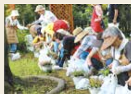
里山ガーデンハウスで寄せ植え講習会開催