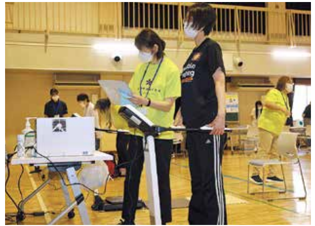
インボディで体組成を測定

6月25日(水)、船迫生涯学習センターで、「からだ測定会」が行われ18歳以上の町民21人が参加し、自分の健康状態のチェックを行いました。会場では、体組成、血圧、握力、口腔機能の測定、ロコモ度チェックを実施後、理学療法士による健康講話や手軽にできる体操を行いました。この測定会は、町民に主体的に健康管理に取り組んでもらおうと町が実施している事業で、令和7年度は11回の開催を予定しています。