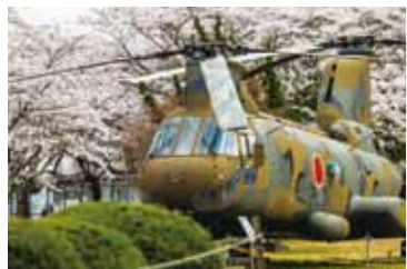
陸上自衛隊船岡駐屯地