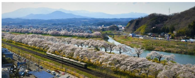
白石川堤 一目千本桜（イメージ）