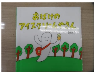
●おばけのアイスクリーム屋さん 作・絵 安西 水丸