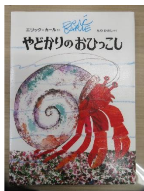
●やどかりのおひっこし 作 エリック=カール