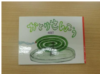
●かとりせんこう 作・絵 田島 征三