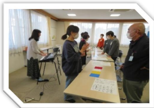
スキルアップ研修の様子